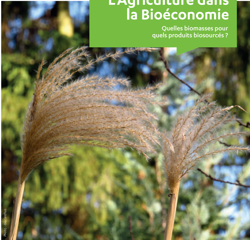
Photo : miscanthus

Quelles biomasses pour quels produits biosourcés ?